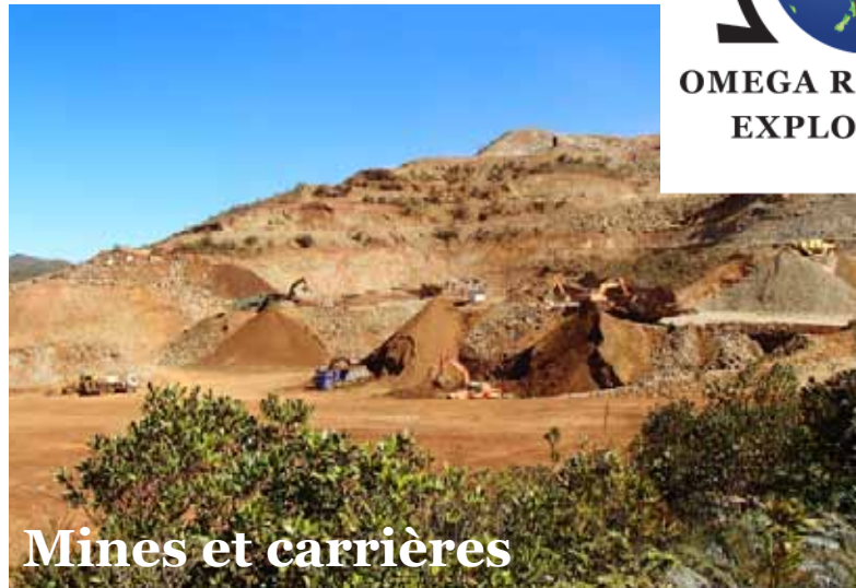
Mines et carrières